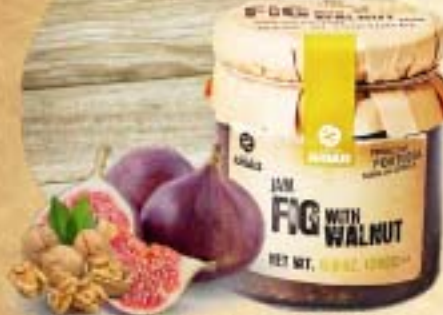
Fig with walnut jam

いちじく&くるみジャム イチジクの甘さとクルミのサクサクした食感が楽しいジャムです。