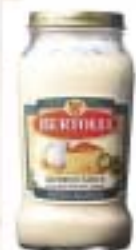
Alfredo Sauce アルフレッド ソース