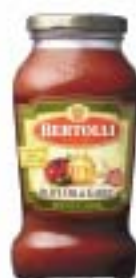
Olive Oil & Garlic オリーブオイル アンド ガーリック