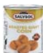
Roasted Giant Corn Nuts ジャイアントコーン

規格 50g×24 商品CD 1325520 POS 8423371 000462 ITF なし 原産国 スペイン 賞味期限 製造日より4年 箱サイズ 220mm×340mm×70mm(2.0kg) 商品サイズ 55mm×55mm×65mm(80g) 参考上代 250円(税別)