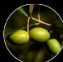
オリアローラ種 甘みとフルーティが際立つ 比較的小ぶりな実