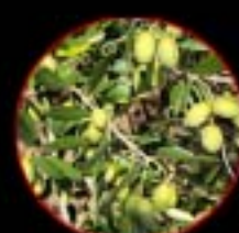
コラティーナ種 苦味と辛みが強い 特徴の強いオリーブ