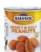
Honey & Salt Peanuts ハニーソルトピーナッツ

規格 60g×24 商品CD 1325518 POS 8423371 000530 ITF なし 原産国 スペイン 賞味期限 製造日より4年 箱サイズ 220mm×340mm×70mm(2.2kg) 商品サイズ 55mm×55mm×65mm(93g) 参考上代 250円(税別)