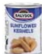
Sunflower Seeds ひまわりの種

規格 60g×24 商品CD 1325524 POS 8423371 000653 ITF なし 原産国 スペイン 賞味期限 製造日より4年 箱サイズ 220mm×340mm×70mm(2.0kg) 商品サイズ 55mm×55mm×65mm(80g) 参考上代 250円(税別)