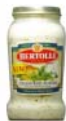
Creamy Basil Alfredo クリーミーバジル アルフレッド