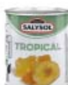
Tropical Fruits Cocktail トロピカルフルーツカクテル

規格 60g×24 商品CD 1325544 POS 8423371 000685 ITF なし 原産国 スペイン 賞味期限 製造日より4年 箱サイズ 220mm×340mm×70mm(2.3kg) 商品サイズ 55mm×55mm×65mm(93g) 参考上代 250円(税別)