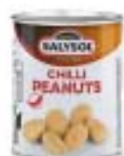
Chili Peanuts チリピーナッツ

規格 55g×24 商品CD 1325528 POS 8423371 000486 ITF なし 原産国 スペイン 賞味期限 製造日より4年 箱サイズ 220mm×340mm×70mm(2.0kg) 商品サイズ 55mm×55mm×65mm(85g) 参考上代 250円(税別)