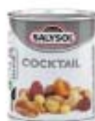
Nuts Cocktail ナッツカクテル

6種類(ピーナッツ・アーモンド・ジャイアントコーン・ヘーゼルナッツ・カシューナッツ・ブラジル産ナッツ)のいろいろなナッツが楽しめます。