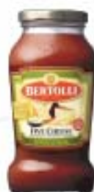
Five cheese ファイブチーズ

プロヴォローネ、パルメザン、アジアーゴ、フォンテーナ、ローマーノの5種類のチーズが配合されています。