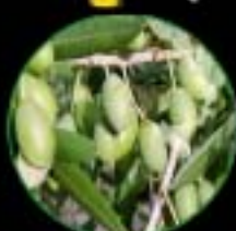
ペランザーナ種 縦長の形が特徴的 さわやかな風味