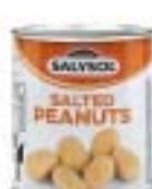
Salted Peanuts ソルテッドピーナッツ

規格 30g×24 商品CD 1325516 POS 8423371 000523 ITF なし 原産国 スペイン 賞味期限 製造日より4年 箱サイズ 220mm×340mm×70mm(1.6kg) 商品サイズ 55mm×55mm×65mm(60g) 参考上代 250円(税別)