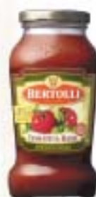
Tomato & Basil トマト アンド バジル

ベルトリーパスタソースの起源は、イタリアの片田舎ルッカで、ベルトリー夫妻が、1865年に小さな食品店を始めた事にさかのぼります。現在では、その5人の息子たちが、「イタリアレストランの味を家庭へ」というコンセプトの基にパスタソースを初めとした様々な製品を送り出しています。